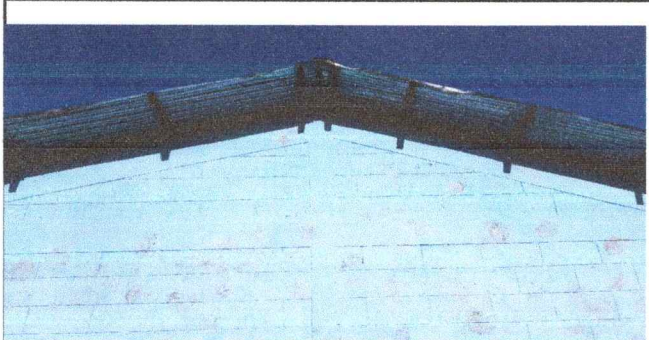
Modulo 1. cubierta de lamina, necesita ser sustituida.