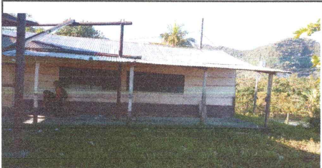
Sustitucion de paredes de cocina.