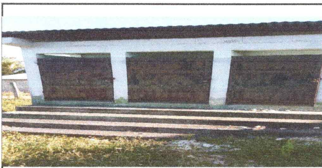
Mantenimiento y lijado de puertas de metal.