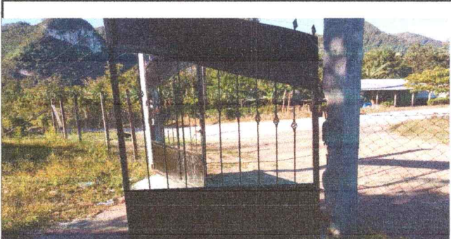
Mantenimiento del porton.